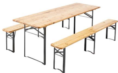
Table 200x60cm 8 personnes 100 tables + 200 bancs

Sauf cas particuliers, la location est du vendredi après-midi avec retour du matériel le lundi.